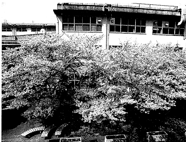
2階閲覧室からの眺め

そしてページの最後には、息抜きにもしてほしいブログとして、目の保養に学内で見かけた植物の写真もよく載せています。図書館前には非常に立派な桜の木が数本ありますが、その咲く様子を毎日定点観測のように撮った写真は特に好評でした。