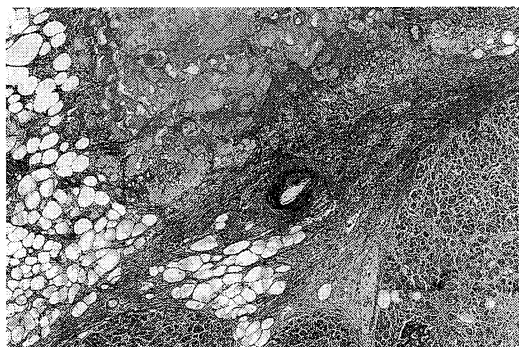
Fig. 3. Photomicrograph of pancreatic tissue showed degeneration, fat necrosis and hemorrhage. Vasculitis was not demonstrated by extensive study of this tissue.

(4) 腎：皮質は菲薄化していた。糸球体は硝子化しているものが認められたが、wire loop lesionは認められなかった。(昭和61年に施行された腎生検所見は、WHO分類のV型に該当していた。)