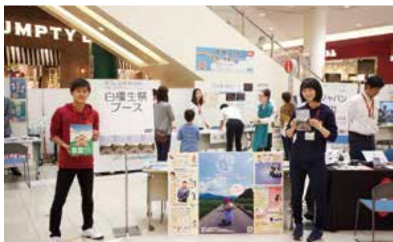
1階スターライトコート

て、メタボリックシンドロームブース、ロコモティブシンドロームブース、睡眠ブース、栄養ブース、痛みのブース、ストレス認知症ブース、アロマブース、アロママッサーブースを出しました。