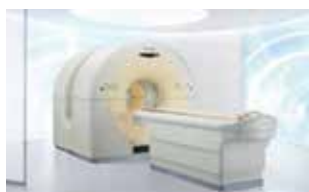
B1F PET-CT 室