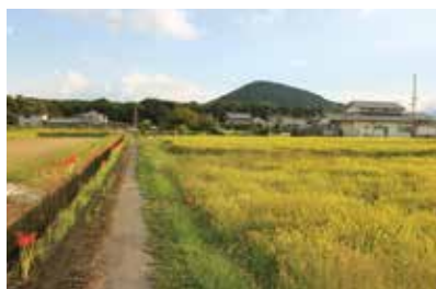
新キャンパス予定地