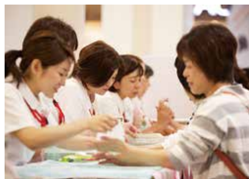
大人気のアロママッサージ

一方、企業ブースとして一般の方でも購入できる商品を展示いただけました。また、奈良県健康づくり推進課のご協力や同時にプレイベントとして開催している白樺生祭のブースも出店し、白樺生祭のゆるキャラであるッしようとした医師くんにも活躍してもらいました。