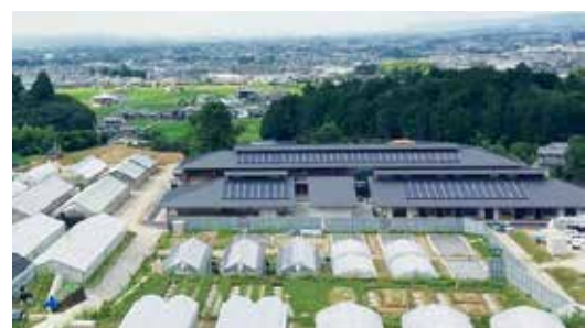
農業研究開発センター(移転後)

県農業試験場は、大正12年に橿原市四条町に開設され、平成12年に「農業技術センター」、平成18年に「農業総合センター」、平成26年に「農業研究開発センター」と組織改編を行いつつも、この間一貫して、奈良県唯一の農業技術に関する試験研究機関として、本県農業を支えてきました。