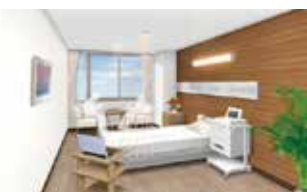
5F 母体胎児集中治療室