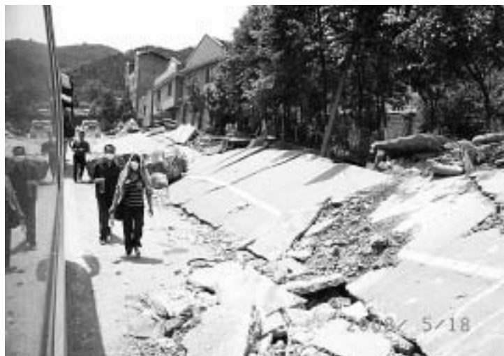
断層が表面に現れ、崩れた道路

先に述べましたように、発災は5月12日、現地時間午後2時28分でありました。私の知った第一報は「中国四川省で大規模な地震が発生した模様。規模はマグニチュード7.8、震源の深さは10km。小学校2校が倒壊、4人死亡、100人以上がケガ」というものでした。その後、徐々に実際の状況が明らかになっていきますが、初期の報道が如何に過小評価になっているかを示すいい例だと思います。ここで、ポイントはマグニチュ