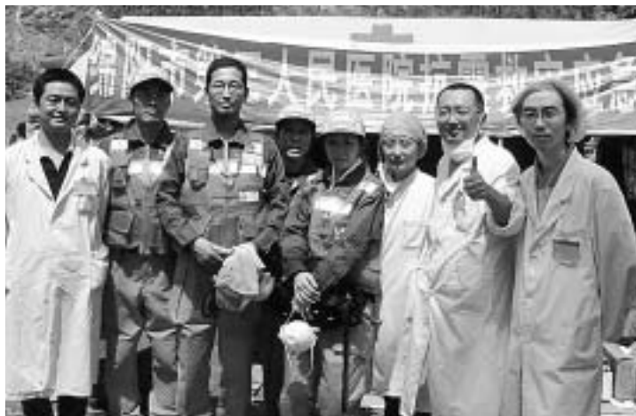
救助チーム医療班と中国の医療チーム 左から3番目が筆者

その日の活動は夜の11時過ぎまで続き、私の連続活動時間はすでに40時間を超えていました。我々の隊は最終的に30名程度の遺体を発見し、十数名の遺体を回収できましたが、残りは中国のチームに託して本部に撤収しました。