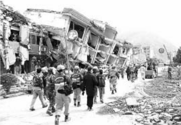
北川の中心部被害状況

よい働きをするぞ」と、我々は心に誓ってひたすら移動を続けました。そして、300km戻って北川に着いた時、日付はもう18日に変わっていました。真夜中、北川に着いた時は激しい雨が降っていました。すぐにでも活動開始といきたいところでしたが、雨の降る真夜中からの活動は2次災害の危険があまりに高いと判断し、偵察部隊を出しただけで、本隊は車中泊となり、夜が明けてからの活動することとしました。