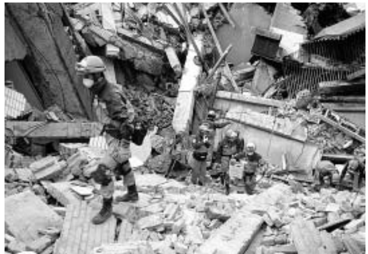
救助チーム活動風景

我々のところにも、地震でできたダムについての情報は中国当局から入っていました。ダム決壊が起こった場合、3分以内で避難するようとの指示でした。3分で周囲は水浸しになり、水位は3m位になるという話です。しかし、周りを見回して目にはいるのは、崩れたビルが崩れかけたビルばかり・・・、「どこに逃げればいいのかだろう？」さすがに、恐怖を感じました。