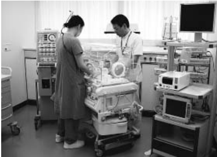
総合周産期母子医療センター